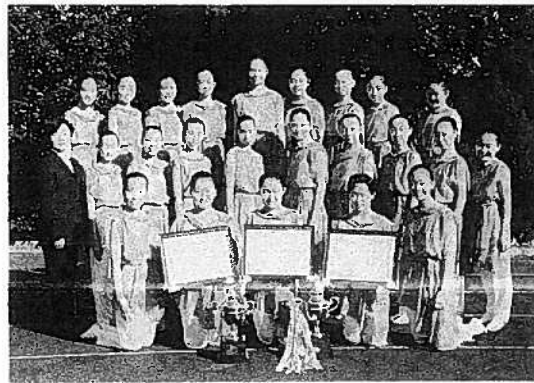
中学校ダンス部 十一月二十三日 芝公園のメルパルクホールで行われた全国中学校高等学校ダンスコンクールで本校のダンス部が四年連続優勝を成し遂げました。これで六回目の優勝になります。三年連続優勝をしたことで特別賞も合わせての受賞になりました。